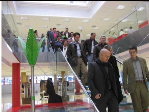
Visita a Pikolinos

Torrellano (Alicante), miércoles 28 de enero de 2009