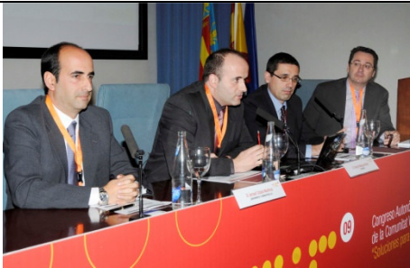
Congreso Autonómico TIC de la Comunidad Valenciana: “Soluciones para las crisis”

Valencia, jueves 10 de diciembre de 2009