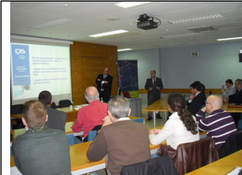
Encuentro Logístico: “¿Cómo mejoró su productividad y disminuyó sus costes Quilosa?”