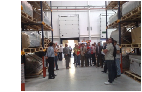
Visita a Grupo Moblerone y Tescoma