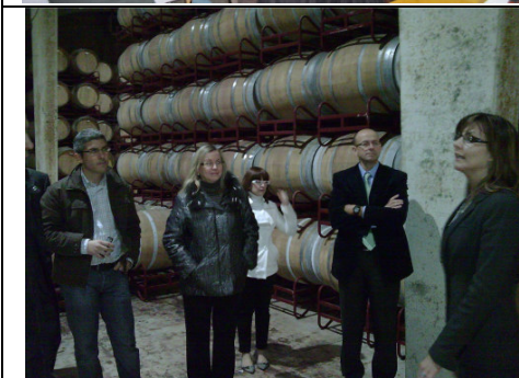
Visita a Bodegas Gandía Plá

Chiva (Valencia), jueves 26 de febrero de 2009