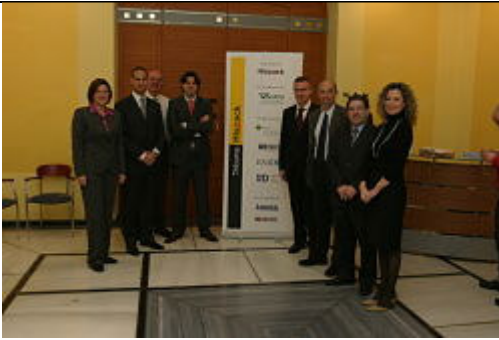
Jornada: "Tribuna Hispack: realidad del envase y embalaje"