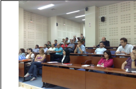
Encuentro Logístico: “Lean Logistics, la logística en forma”